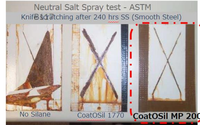
著しく不良 不良 良好